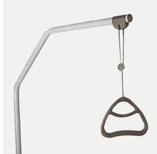
Alzamalati ad innesto Regolabile in altezza.