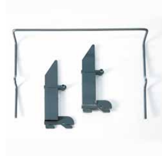
Kit di estensione della rete E' disponibile un kit per allungare la rete di 15 cm (optional).