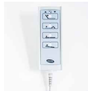
Pulsantiera Con funzione di bloccaggio delle funzioni del letto (ACP).