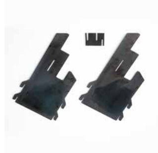
Kit di trasporto Per movimentare il letto con maggiore facilità.